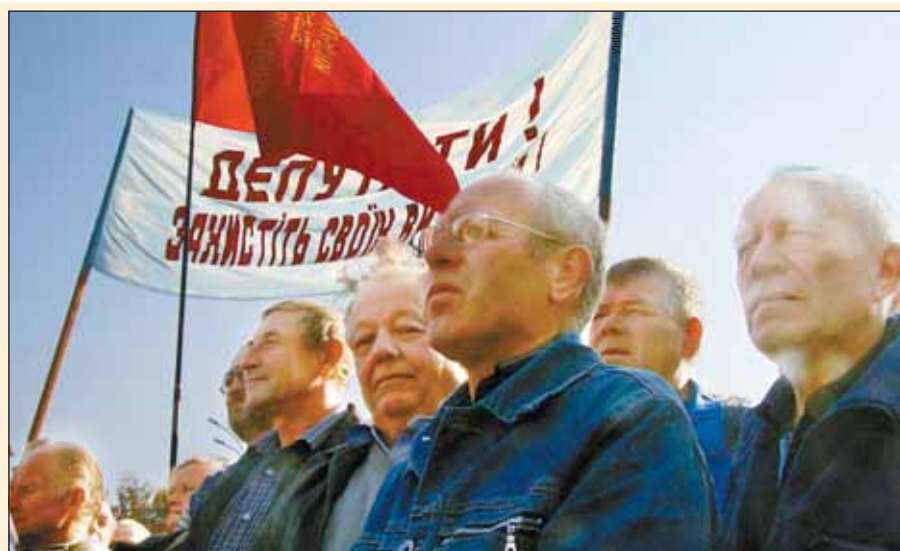
28 сентября у стен Полтавского областного совета прошел пикет афганцев и сторонников КПУ. Участники акции выступили против голосования в ВР законопроекта № 9127, который сужает льготы 16 категориям граждан

Центр подготовки государственных горнотехнических инспекторов, открывшийся при ГП «Лу-