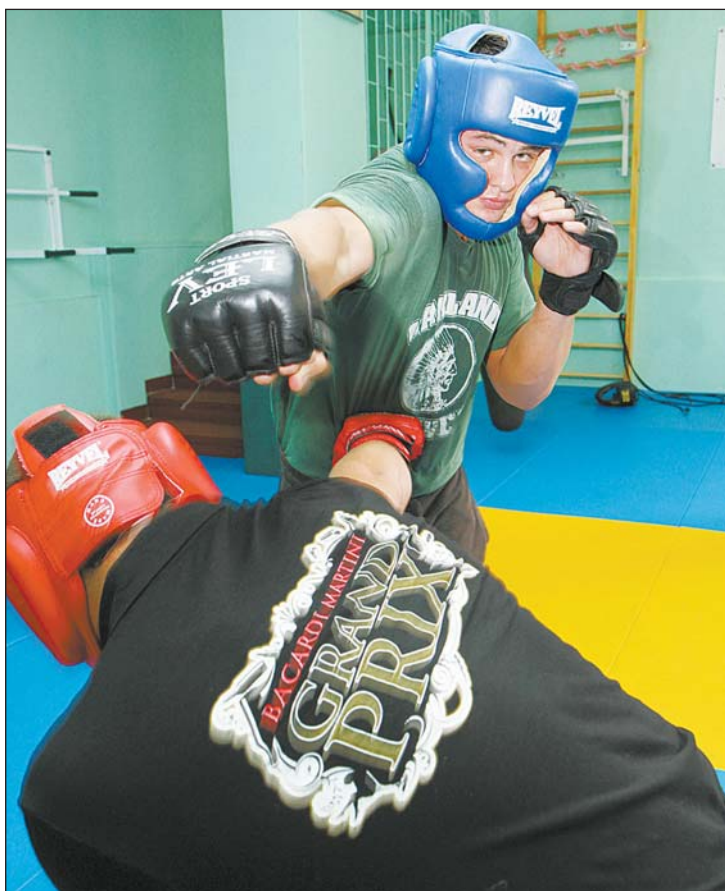
Не каждая охранная фирма имеет свою тренировочную базу

И кстати, в рамках обсуждения Стратегии развития города неплохо бы предложить киевской власти вернуть эту инициативу и обеспечить учебные заведения города охраной не за родительский счет.