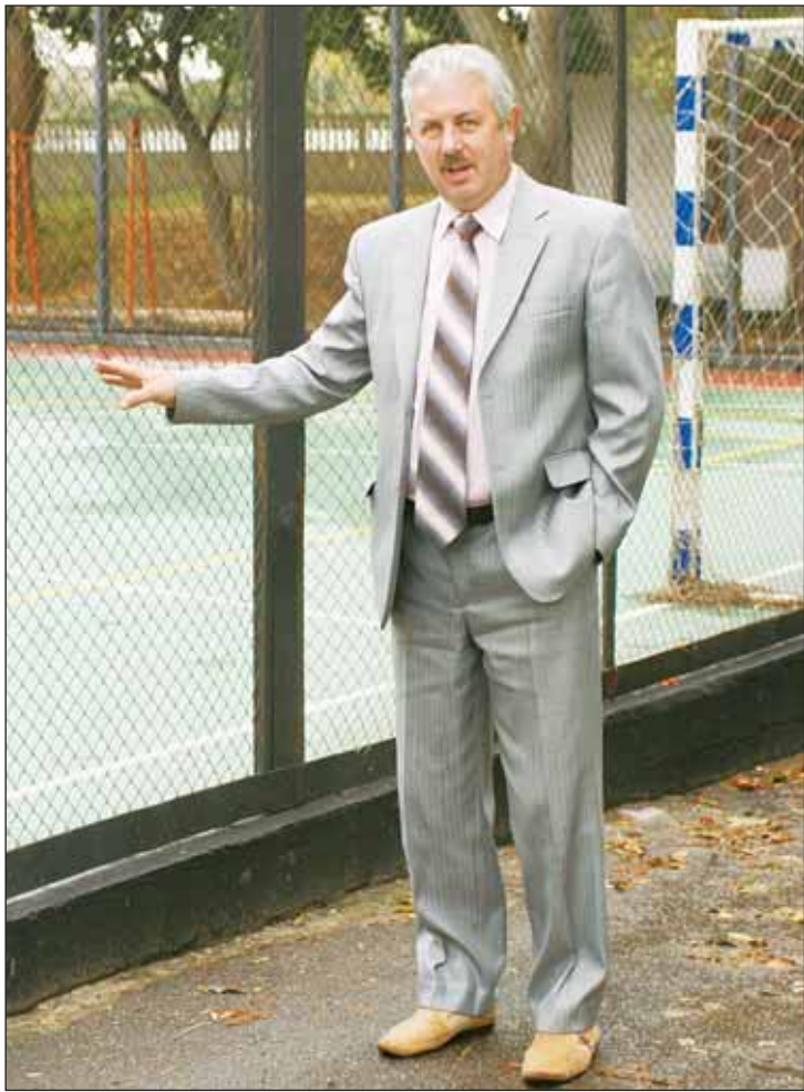
Мэр Николай Майданюк: это покрытие выдержит любые зной и мороз