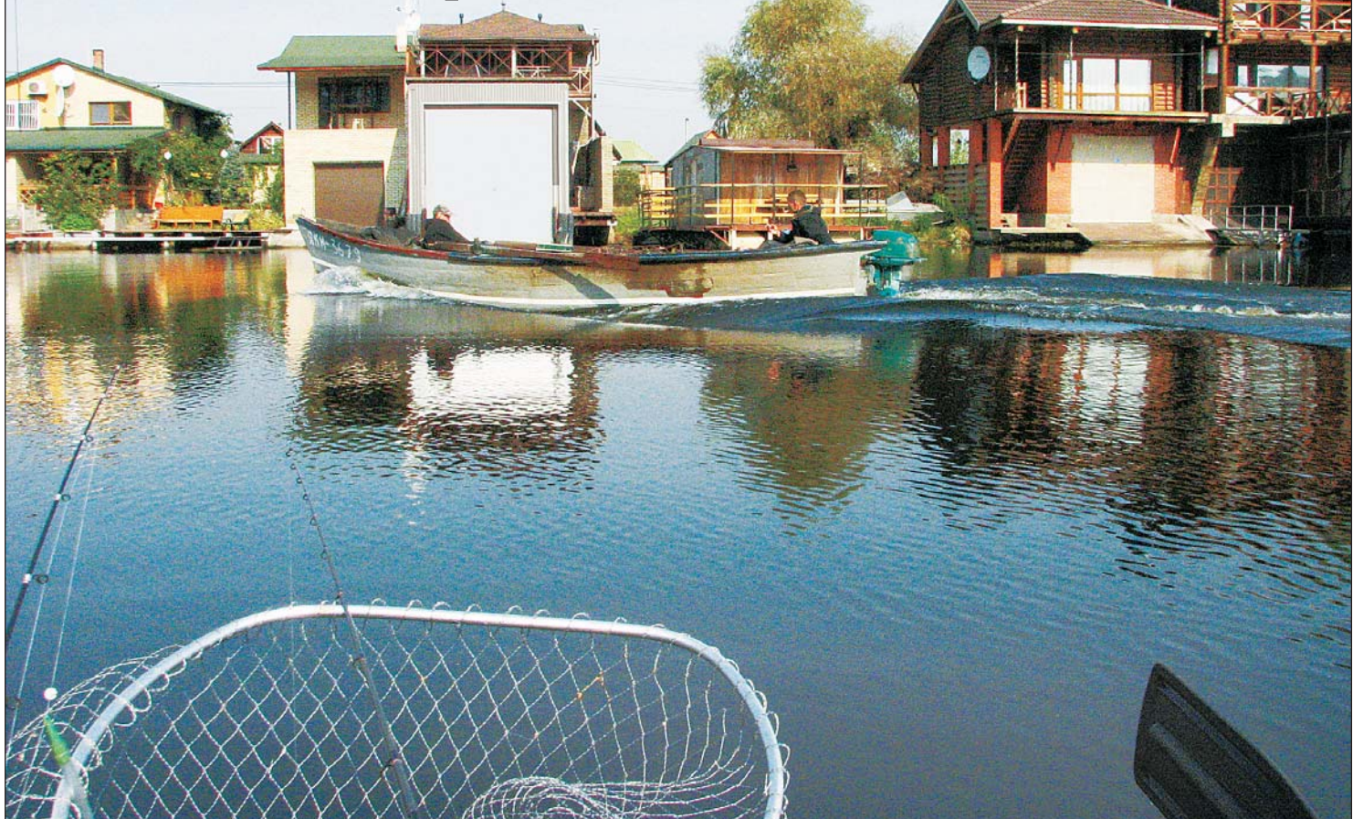
Почти все богатые дачники имеют гаражи для катеров

А я ведь заметил, что поводок после второй щуки стал расслаиваться, но решил, что он продержится и на шести жилках — день клонился к закату, думал — проскочу. Ан нет! Пришлось пожертвовать реке добычливую блесну стоимостью 20 грн. Обычно самодельного поводка хватает на пять-шесть рыбалок, если, конечно, отслеживать его состояние. Это мне, ленивому, урок.