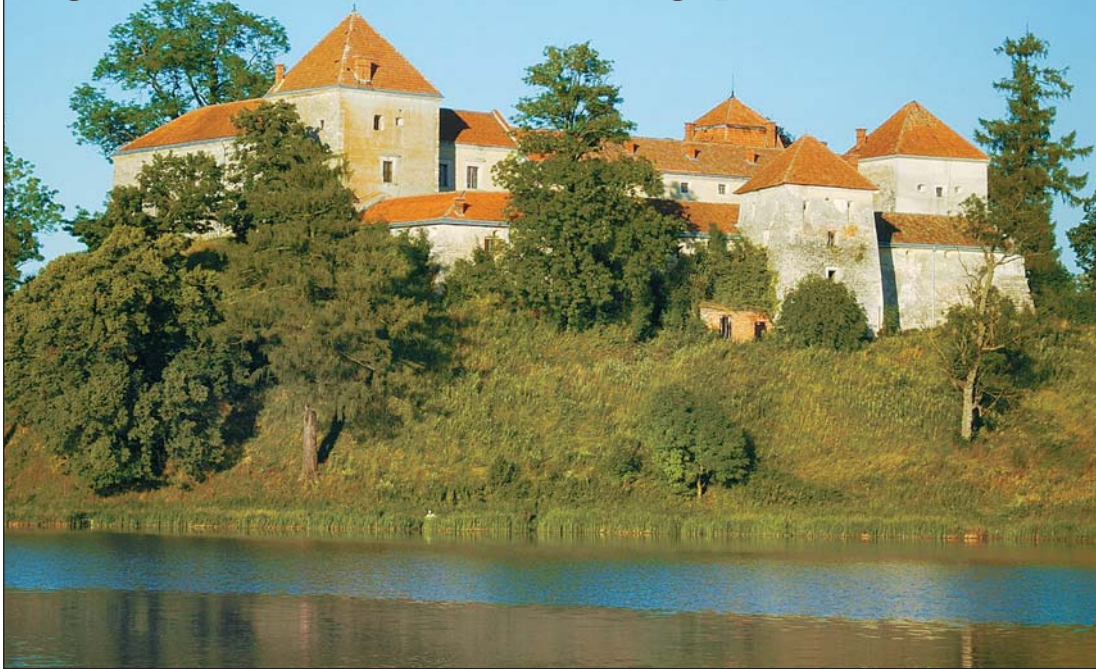
Львовская обл. Замок Свирж